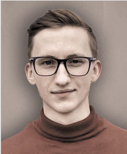
ИВАН СТЕЛЬМАХ (Ivan Stelmakh)