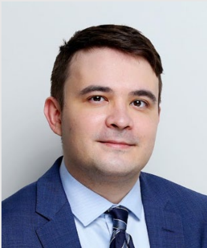
МАРАТ САЛИХОВ (Salikhov Marat)